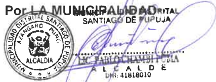
Por LA MUNICIPALIDAD PABLO CHAMBI PUMA Alcalde