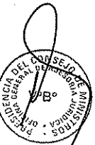
OLLANTA HUMALA TASSO Presidente Constitucional de la República