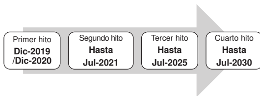
Gráfico N° 1: Hitos temporales del Plan Nacional de Competitividad y Productividad

El primer hito temporal responde al seguimiento de medidas de corto plazo que representan las etapas iniciales de medidas en implementación. El segundo hito temporal representa los logros del gobierno hacia el Bicentenario y está vinculado con los objetivos establecidos en el Decreto Supremo N° 054-2011-PCM, en tanto sus Ejes Estratégicos incluyen fines que han sido recogidos en la PNCP. El tercer hito, julio 2025, corresponde a los logros hacia el mediano plazo. Finalmente, el cuarto hito, hacia julio de 2030, corresponde a los logros de largo plazo, vinculados a los Objetivos de Desarrollo Sostenible. El horizonte temporal planteado, abarca tres administraciones gubernamentales, lo cual es consistente con el propósito de la PNCP de representar una política de Estado y no de un solo gobierno.