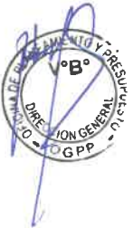
Ing. GUSTAVO EDUARDO MOSTAJO OCOLA MINISTRO DE AGRICULTURA Y RIEGO